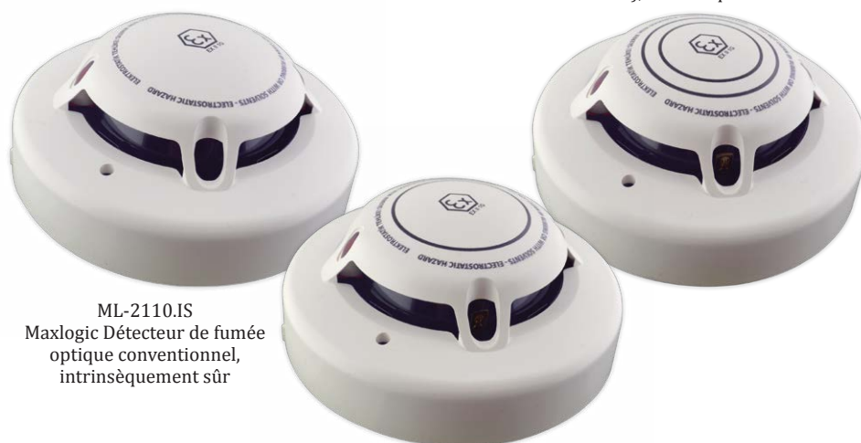
ML-2110.IS Maxlogic Détecteur de fumée optique conventionnel, intrinsèquement sûr

Une protection maximale est obtenue grâce aux détecteurs d'incendie de la série ML-21XX.IS, faciles à installer et à utiliser et dotés d'une structure ergonomique.