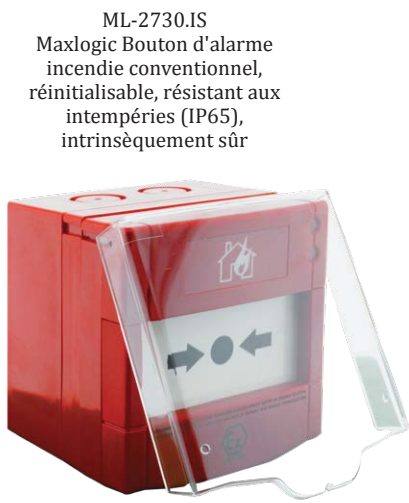
ML-2730.IS Maxlogic Bouton d'alarme incendie conventionnel, réinitialisable, résistant aux intempéries (IP65), intrinsèquement sûr