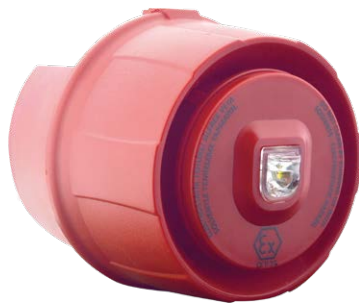
ML-2490.IS Maxlogic Sirène clignotante conventionnelle, résistante aux intempéries (IP65), intrinsèquement sûr