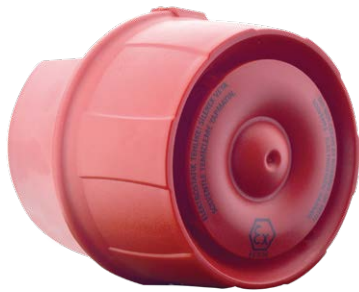
ML-2470.IS Maxlogic Sirène conventionnelle, résistante aux intempéries (IP65), intrinsèquement sûr

Spécialement conçu pour les emplacements à haut risque où la certification ATEX est requise et où des performances de détection sensibles et stables sont importantes produit. Sirènes/sirènes stroboscopiques/stroboscope série ML-24X0.IS, faciles à installer et à utiliser, structure ergonomique, alarme incendie adressable intelligente ce sont des produits qui peuvent être utilisés en commun par tous les systèmes, des systèmes d'alarme incendie aux systèmes d'alarme incendie conventionnels.