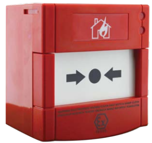
ML-2710.IS Maxlogic Bouton d'alarme incendie conventionnel, réinitialisable, intrinsèquement sûr

Spécialement conçu pour les emplacements à haut risque où la certification ATEX est requise et où des performances de détection sensibles et stables sont importantes. Les boutons de la série ML-27X0.IS, faciles à installer et à utiliser et dotés d'une structure ergonomique, sont préférés car ils sont compatibles avec tous les systèmes d'alarme incendie conventionnels.