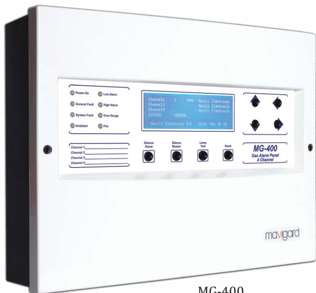
MG-400 Panneau de contrôle d'alarme de gaz, 4 canaux

Ce sont des panneaux d'alarme gaz d'apparence moderne, avec une capacité de 4 canaux, des performances de fonctionnement supérieures et stables. Il offre de nombreuses fonctionnalités adaptées à une utilisation dans les applications d'automatisation avec des performances de fonctionnement supérieures.